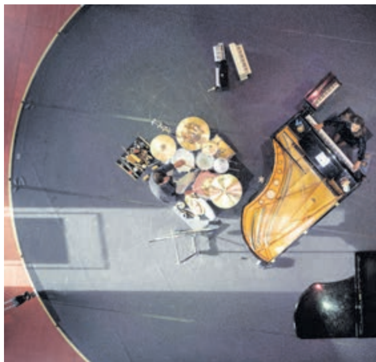
Die Musik erinnert an russische Umwälzungen.

Weitere Aufführungen am 26. und 30. Juli. Weitere Informationen zum Spielplan und Öffnungszeiten unter www.origen.ch oder im Produktionsbüro in Riom via E-Mail an info@origen.ch oder telefonisch unter 081 637 16 81.