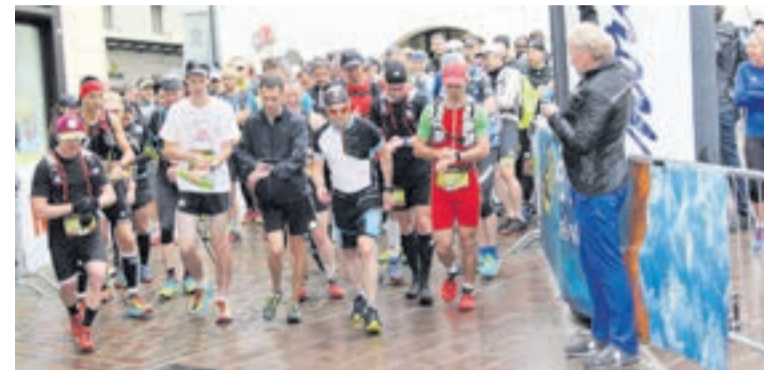
Der Start einer Kategorie in St. Moritz

gorien mit einer Lauflänge zwischen drei und fünf Kilometer. Anmeldung ab 17.15 Uhr beim unteren Parkplatz in Surlej. Frei zugängliche Postennetze zu Trainingszwecken gibt es auch auf Muttas Muragl, Corviglia/Marguns, Furtshellas und dem Corvatsch. Die Karten sind an den entsprechenden Talstationen zu erwerben. (Einges.)