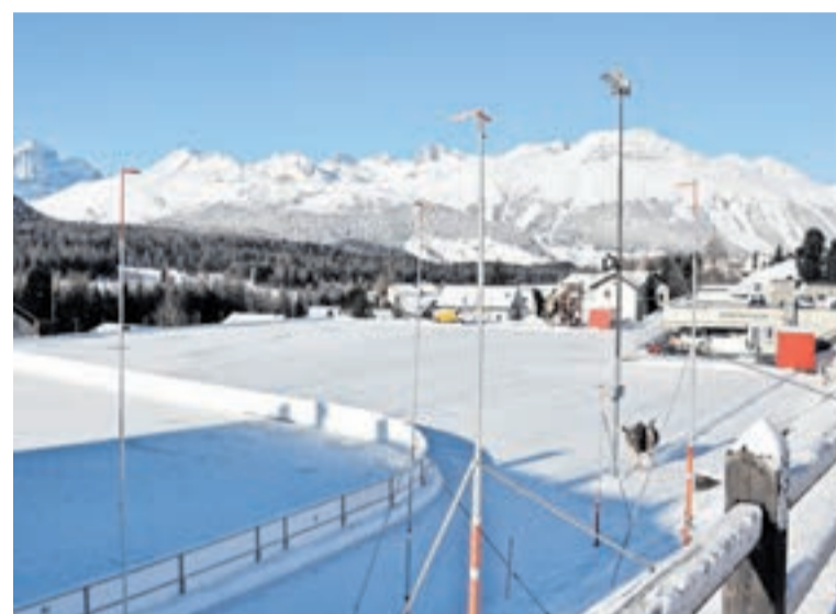
An diesem Standort in Pontresina soll das Hotelprojekt Al Flaz realisiert werden.

Das Urteil ist noch nicht rechtskräftig und kann an das Bundesgericht weitergezogen werden. Ob das geschieht, ist laut Anwalt der beiden Beschwerdeführer noch nicht entschieden. (rs)