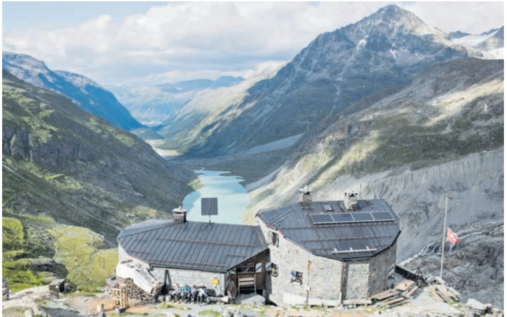
Imposanter Ausblick von der Coazhütte in Richtung Gletschersee, Val Roseg und Pontresina.