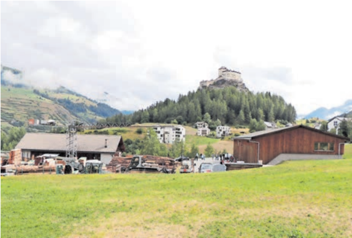
La Resgia da Tarasp es gnüda fabbrichada dal 1918.