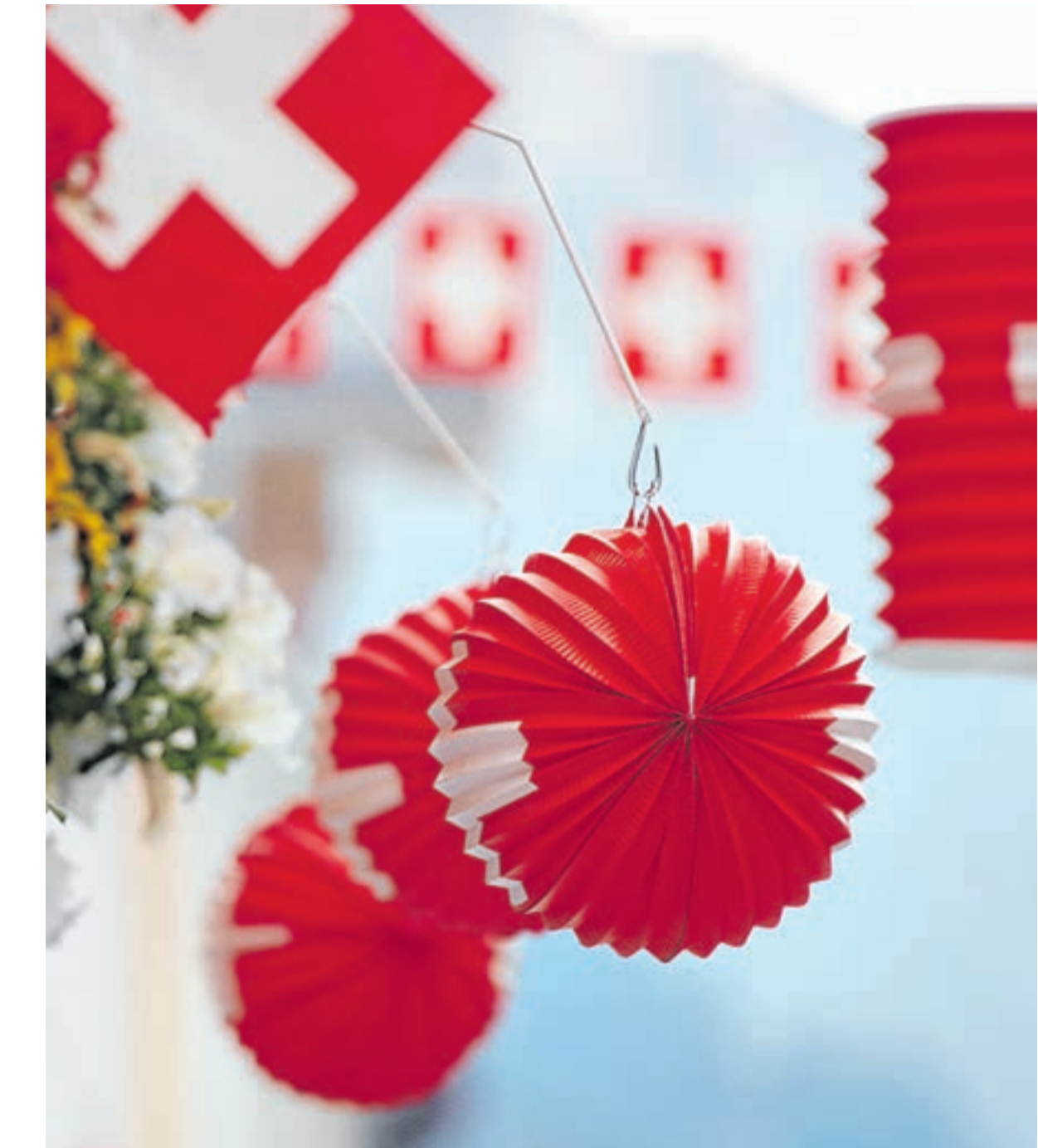
1. August in der Schweiz, ein Land erstrahlt in Rot-Weiss.

A las 20.45 cortegi da lampiuns Bügl Suot – Ftan Pitschen – piazza da scoula accompagnad da la Societad da musica. A