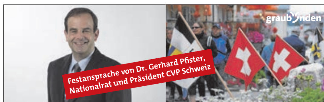
Festansprache von Dr. Gerhard Pfister, Nationalrat und Präsident CVP Schweiz