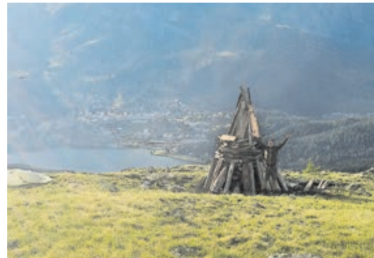
Der Aufbau der Bergfeuer ist aufwendig.

Ob in diesem Jahr Höhenfeuer entfacht werden dürfen, ist noch ungewiss. Denn warmes, trockenes Sommerwetter begünstigt Wald- und Flurbrände. Deshalb gibt es in gewissen Gebieten Graubündens ein striktes Feuerverbot. In der Nähe vom oder im Wald dürfen darum auch keine Grillstellen benutzt werden. Im Moment sind das Engadin, das Münsertal und Samnaun vom Verbot noch nicht betroffen. Die Situation wird laufend neu beurteilt und wenn nötig, auf weitere Gebiete ausgedehnt. Gemeindebehörden und Feuerwehren geben entsprechende Anweisungen, heisst es auf der Website des Amtes für Wald und Naturgefahren.