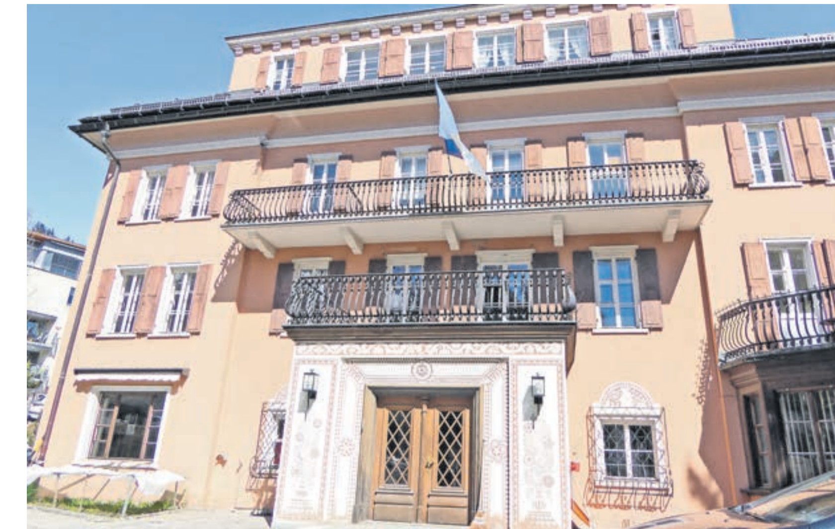
La Procap Grischun as rechatta illa Chesa Ruppena a Samedan.

Scu cha Ruckstuhl intuna, nu saja la Procap tar la populaziun uschè cuntshainta scu per exaimpel la Pro Infirmitas, Pro Juventute o la Pro Senectute. «Perque ans sto fermamaing a cour da comunicar cha nus güdains a noss commembers in tuot ils cas pussibels», intuna'l. Cha commember as dvainta cun pajer 50 francs contribuziun l'an. Ils commembers vegnan trapartieus in commembers activs e